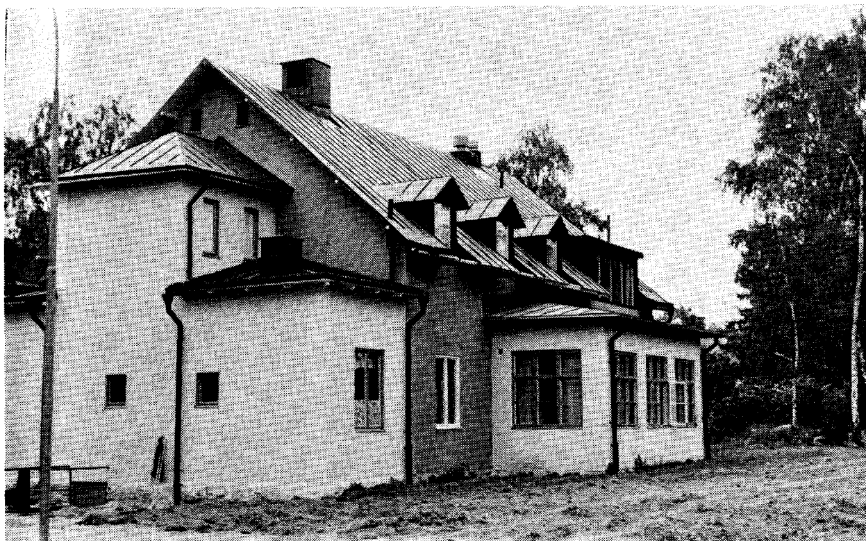
Underofficersmässen efter reovering 1968.

jämte fem bostäder om ett rum o kök nyinreddes å övre våningen. Denna ombyggnad kostade 10.600 kronor inklusive 100 kronor till desinficeringskostnad! 21)