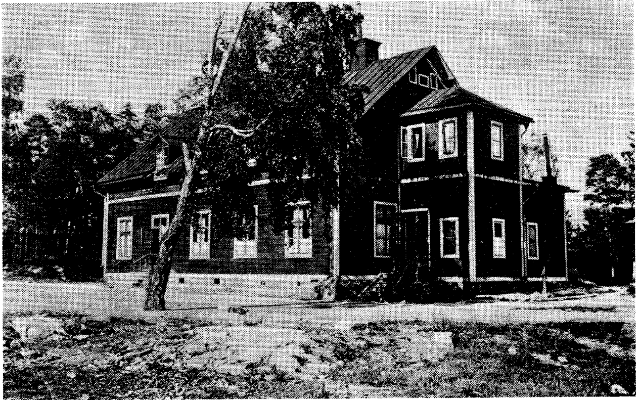
Underofficersmässen på 1920-talet. F. d. "grågubbarnas Kapernaum".

men dagavgiften höjdes till 37 öre. Holmgren fick en stor, ehuru nog så svårhanterlig arbetsstyrka för en även för denna tid närmast otillbörligt låg kostnad. Fr.o.m. november 1882 t.o.m. maj 1890 utfördes 67.775 dagsverken åt Holmgren. Medelvärdet per dagsverke var 32 öre och Holmgren betalade sålunda till fångvårdsstyrelsen knappt 22.000 kronor för dessa stora arbetsstyrkor under dryga 9 år! 20)