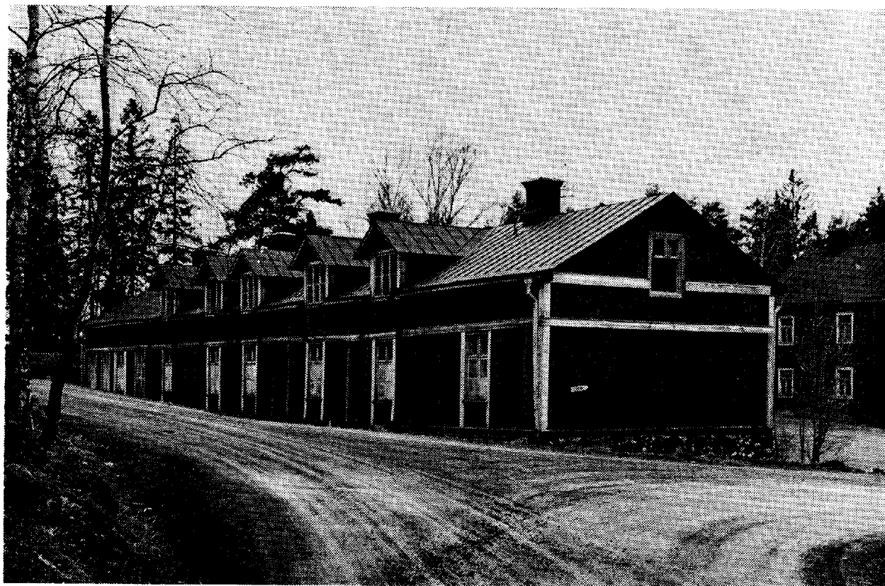
"Gamla sjukhuset" vid OF strax före rivningen 1967. Byggnaden flyttades från Slite på Gotland 1869. I bakgrunden "Gamla kansliet".