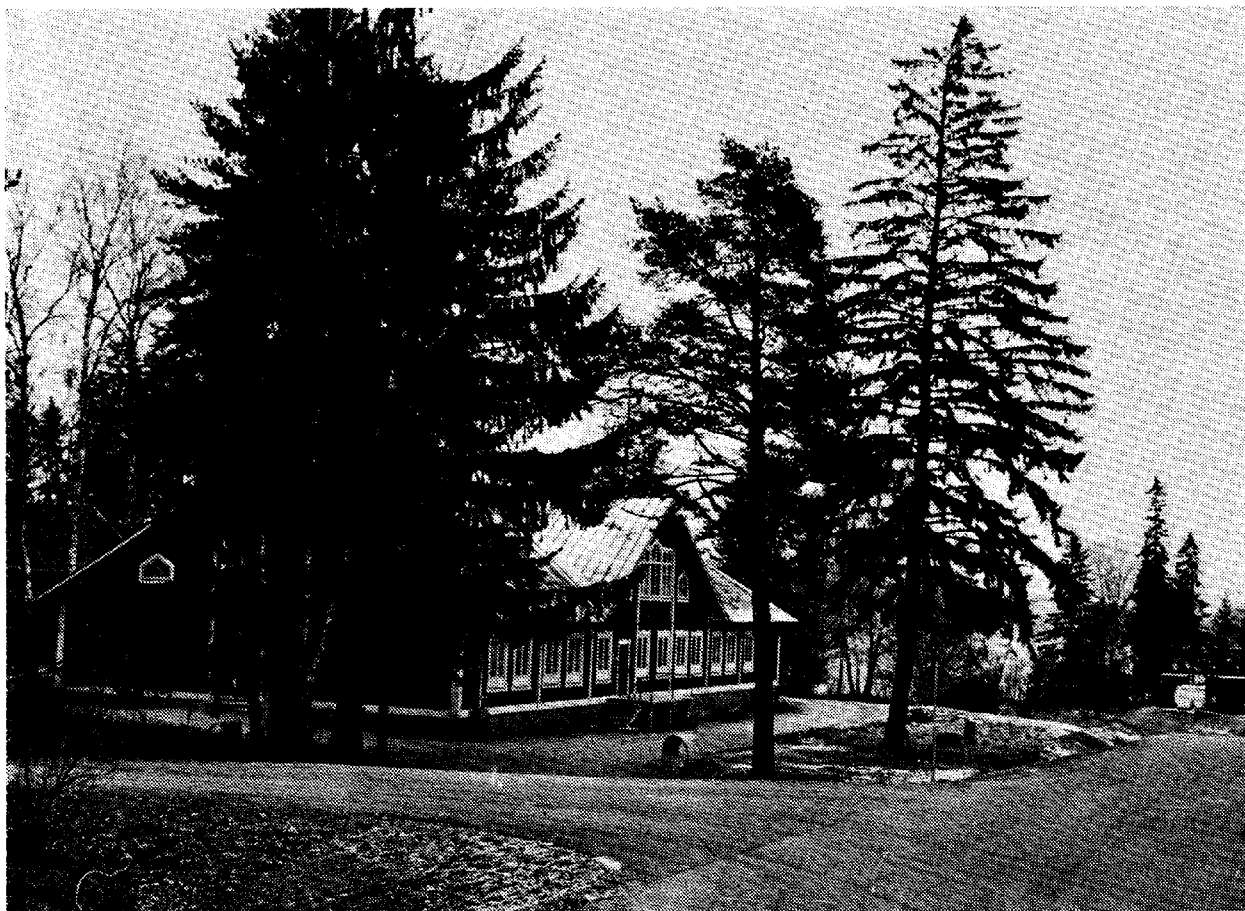
KA 1:s övningsförråd f.d. manskapsbaracken på Vaxö läger, där den uppfördes 1884 och flyttades därifrån 1905. På dess grund uppfördes Storstugan 1909.

Fem burspråk med fönster åt väster togs upp och ett fönster på vardera gaveln. Bottenvåningen innehöll 10 rum, pentry, toalett och två förstugor med var sin trappa till övervåningen, takhöjd var här 2,7 m. Ett par rum "dekorerades" vid en senare renovering (1915) med motiv av Vaxholms och Fredriksborgs fort, batterier m.m. En sentens i vackert textade bokstäver — "Bakom molnen är himlen blå" — krönte det hela. Konstverken var signerade med "621 Arfvidson, 7 komp 1915". 16)