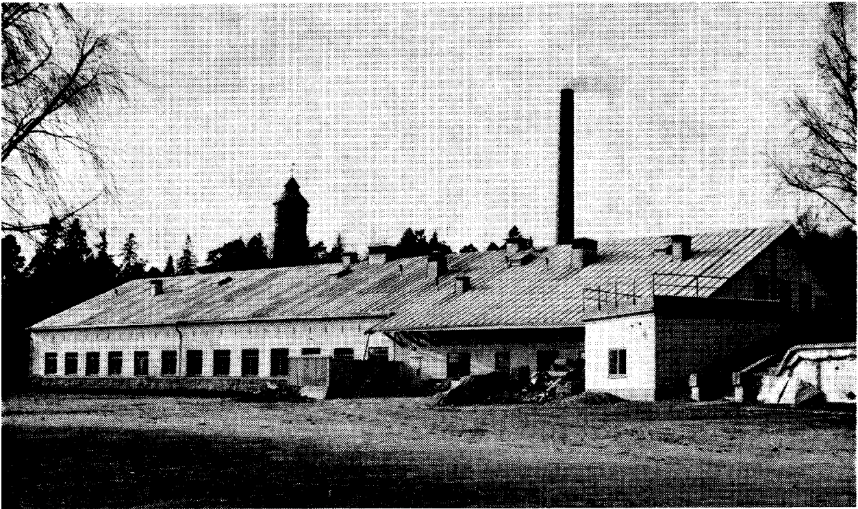
Fabriksbyggnaden från 1880-talet, numera KA 1:s matsal. Moderniserad 1954.

Huvudförläggningen för "grågubbarna" var i början Rindö redutt, en halv mils väg från Brännudden. En mindre avdelning låg i Fredriksborg på Värmdö.